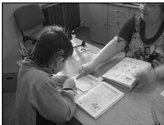
Egyéni fejlesztés a Nevelési Tanácsadóban

A pályázat átanulmányozása során egyértelművé vált, hogy Szakszolgálatunk számára nagy lehetőséget nyújt ez a partneri felkérés. Jó néhány, a szakmai kompetenciánkat és tudástárunkat növelő ismeretre tehetünk szert a pályázat jóvoltából és a terveink szerint az új ismeretek szervesen beépülnek a mindennapi szakszolgálati munkába.