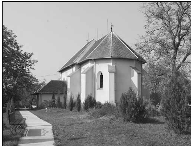
A szőlősgyulai református templom

Október közepén olyan szerencsés meglepetés ért bennünket, hogy a régi Ugocsa megyében, annak is ma Kárpátaljához tartozó részén voltunk kerékpárral kirándulni, és egy igazi kun falut találtunk. Ugocsa, a történelmi Magyarország egyik legkisebb vármegyéje volt. Két járása közül a Tiszántúli, a folyó felőlünk, tehát Karcag irányába eső oldalán feküdt. Itt, az Avas hegység lábánál található Szőlősgyula, melynek telepítése, vélhetően a középkori Káta nemzetiség által, 1337 és 1396 között történt. Szabó István, Ugocsa megye című monográfiája szerint, 1862-ben 394 magyar református lakosa volt, 1910-ben pedig, 747 fő volt népessége. 1989-es adat szerint, 1321-en lakták a színmagyar falut. Jelenleg kb. 1500-an vannak, mind magyarok, és ahogy a helybeliekkel beszélgettünk, kun származásuknak ma is tudatában vannak,